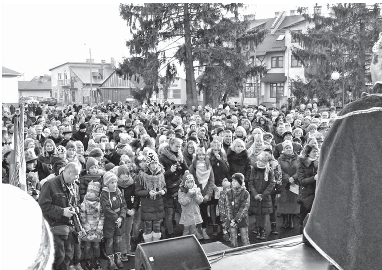
Orszak przyciągnął tłumy mieszkańców gminy Piszczac.