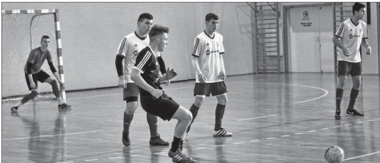
Piłkarze z Piszczaca (w białych strojach) walczyli do końca.