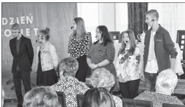
Spektakl wystawiła młodzież z gimnazjum z ZPO w Piszczacu.