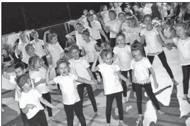
Dzieci z grupy tanecznej GCKiS w pokazie charytatywnym.