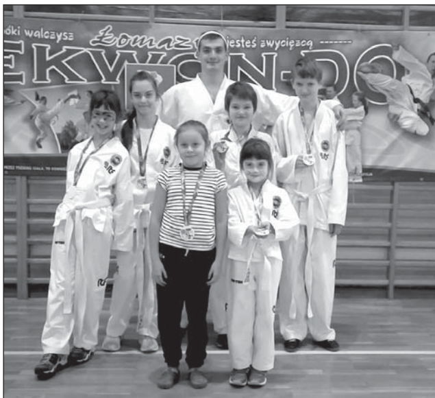
Młodzi adepci taekwondo z Piszczaca.