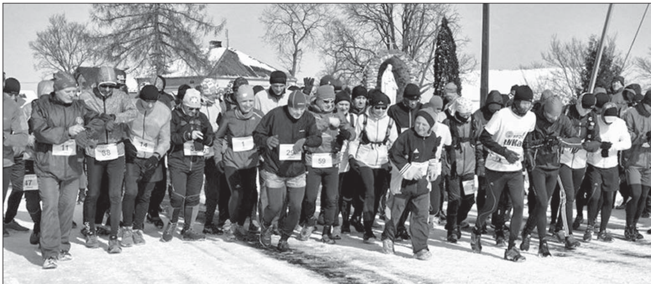
Start maratonu przy kościele w Połoskach.