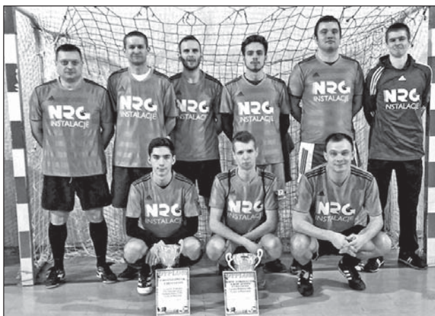
Chotyłowiak Chotyłów zajął 2 miejsce.