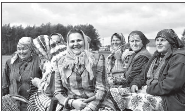
Wyjazd na pole.