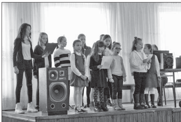
Występy dzieci z Dobrynki.