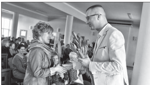
Symboliczny kwiatek od Wójta.