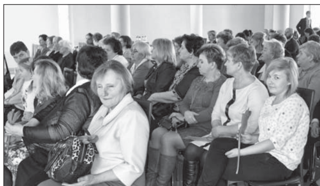
W spotkaniu uczestniczyło blisko 100 pań.