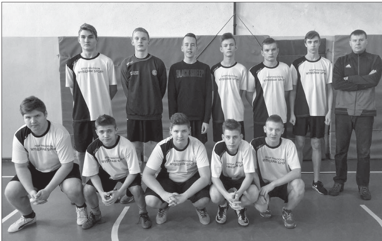
Młodzi koszykarze z gimnazjum w Piszczacu zajęli 2 miejsce w powiecie bialskim.