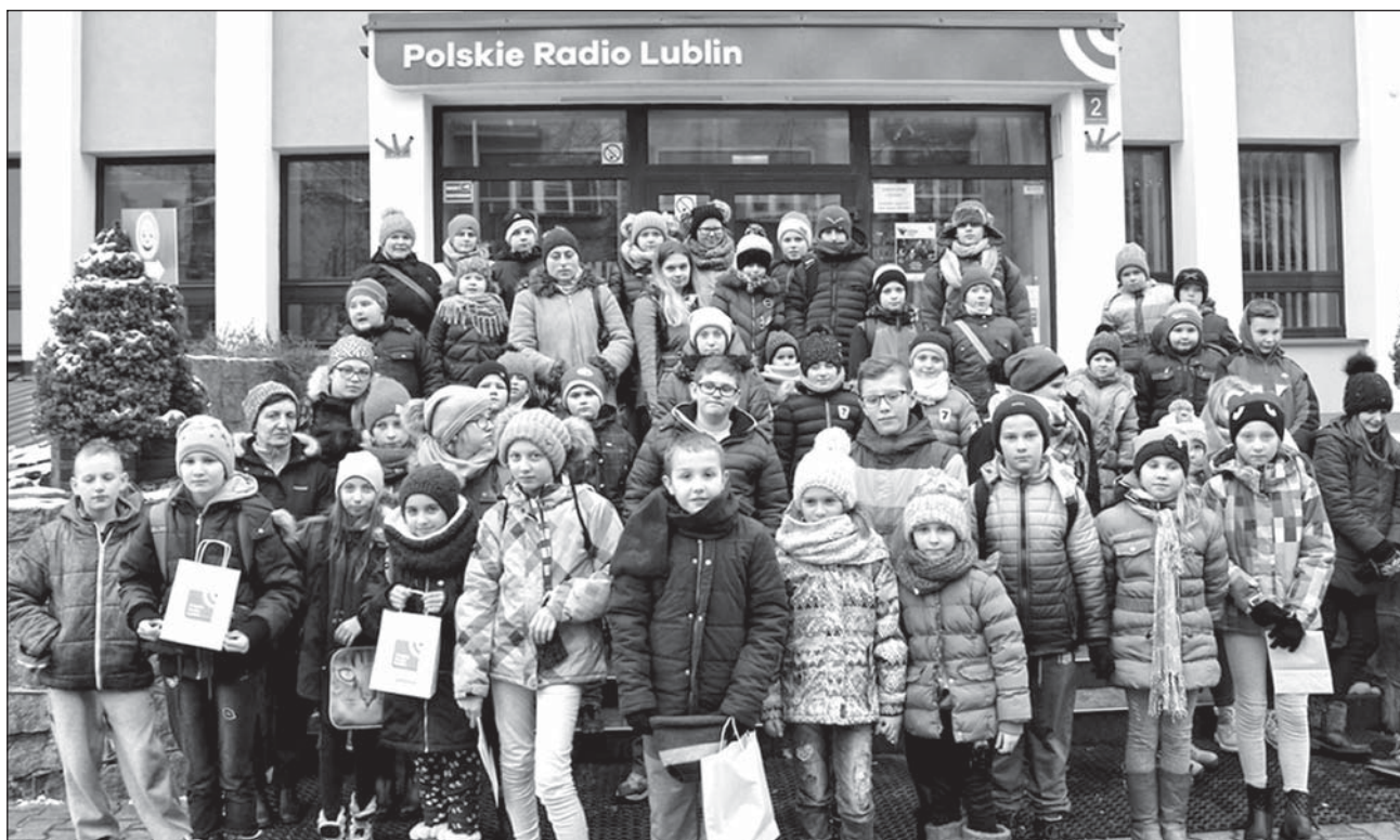
Orszak przyciągnął tłumy mieszkańców gminy Piszczac.

W ramach odpoczynku od edukacji przygotowano zostały także warsztaty wykonywania figurek z masy solnej. Podczas zajęć powstało całe mnóstwo kolorowych figurek. Odbyły się również kolejne zajęcia kulinarne, na których uczestnicy przygotowali frytki. W drugiej połowie ferii dzieci zamieniły się w wesołe kotki i motylki malowania twarzy. Ponadto dzieci malowały farbami na ogromnej kartce papieru. Nie zabrakło również zajęć walentynkowych, na których uczestnicy wykonali serduszka na patycz-