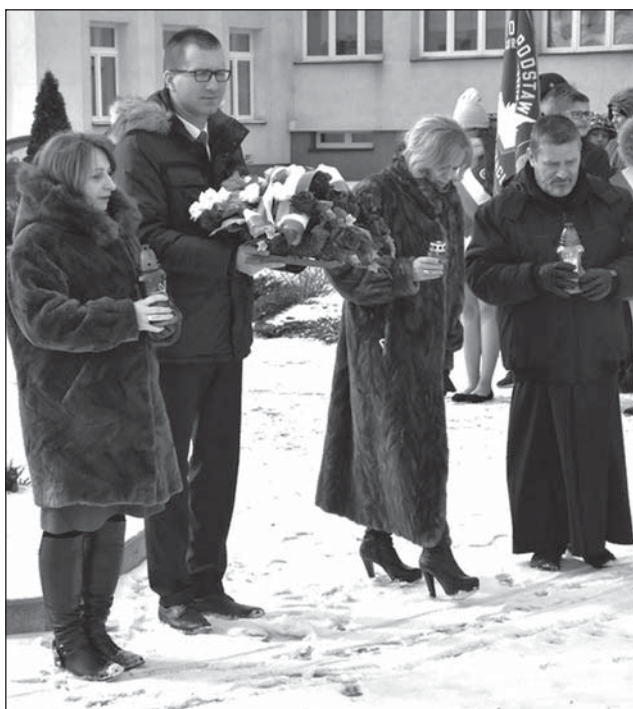
Złożenie kwiatów i zniczy pod muralem.