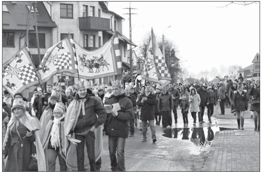
Przemarsz orszaku ulicami Piszczaca.