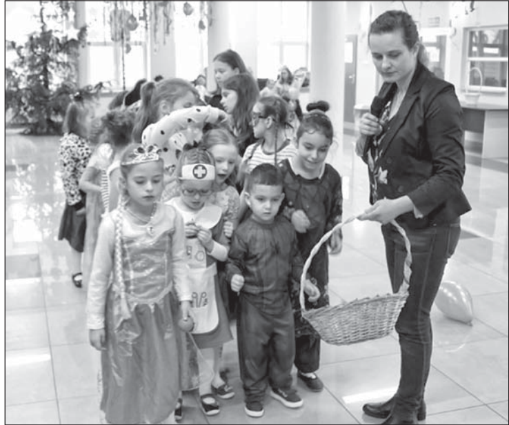
W ferie odbył się bal karnawałowy.