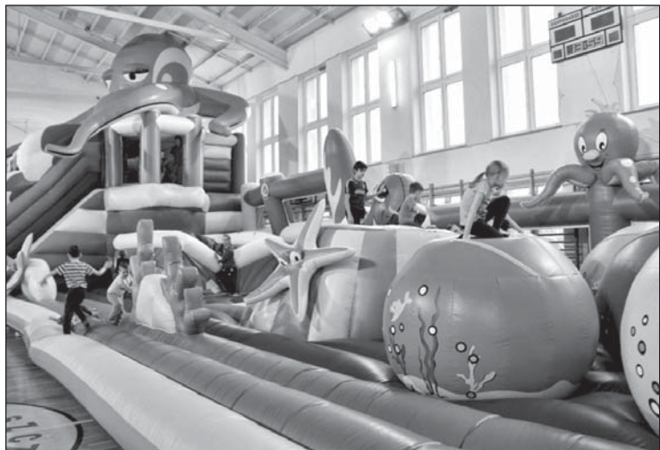
Dmuchany plac zabaw cieszył się ogromnym zainteresowaniem.