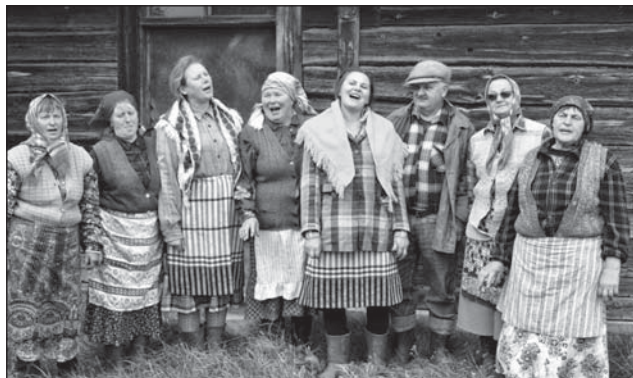
Na koniec były śpiewy.