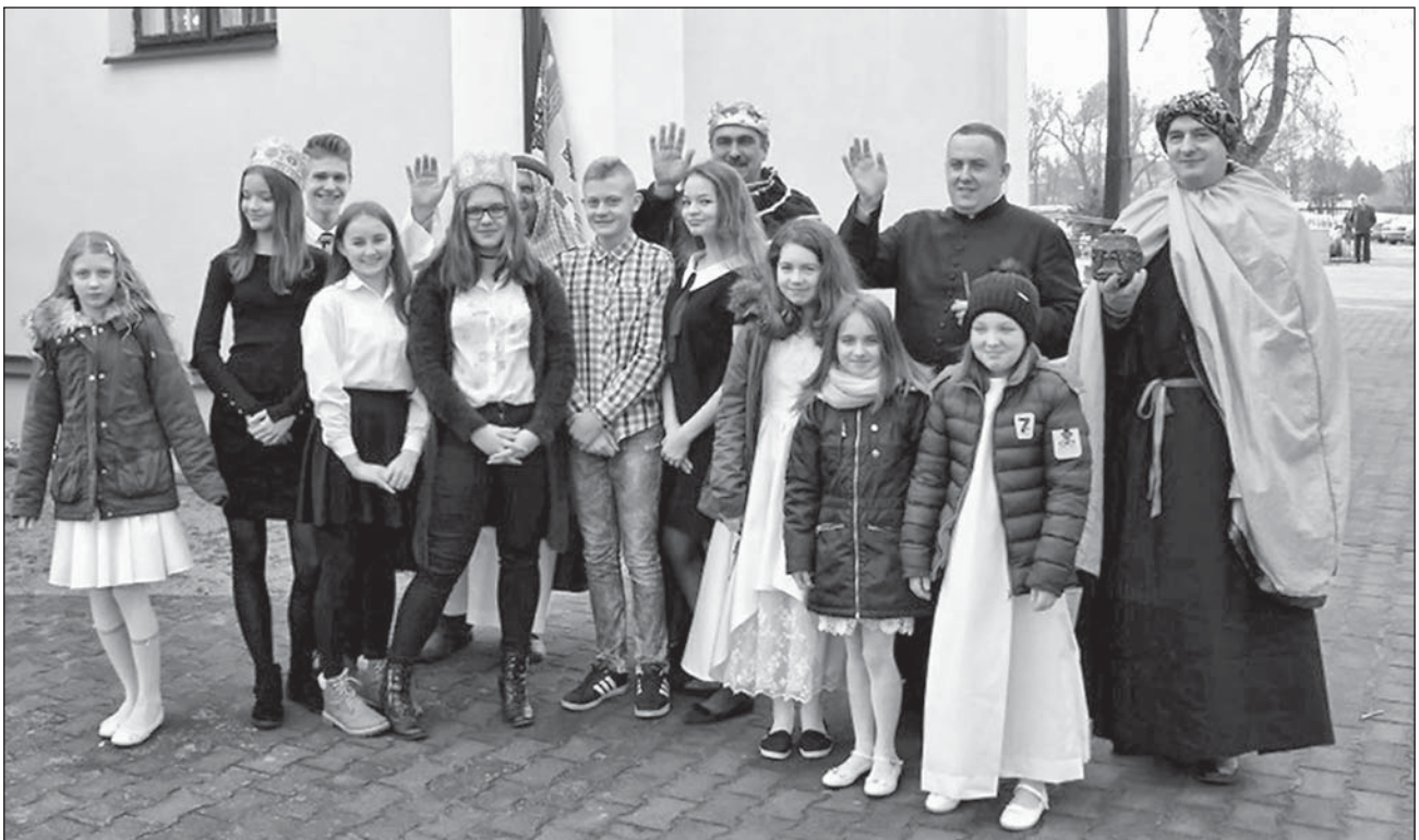
Trzej Królowie w otoczeniu młodzieży.