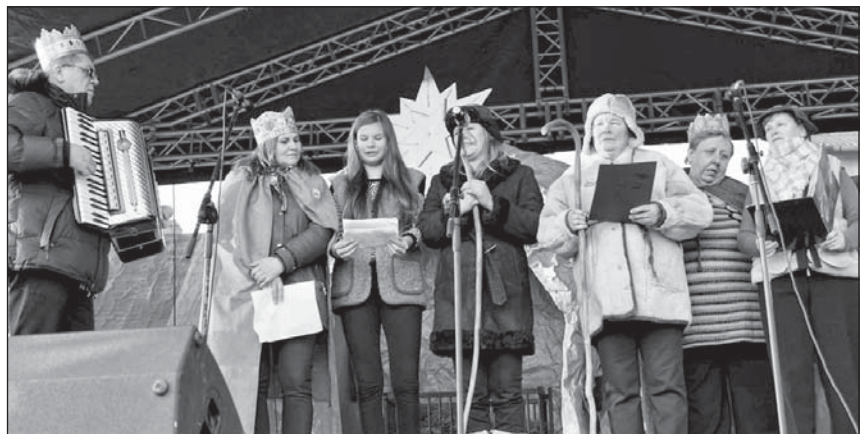
Zespół „Na swojską nutę” z Zahorowa.