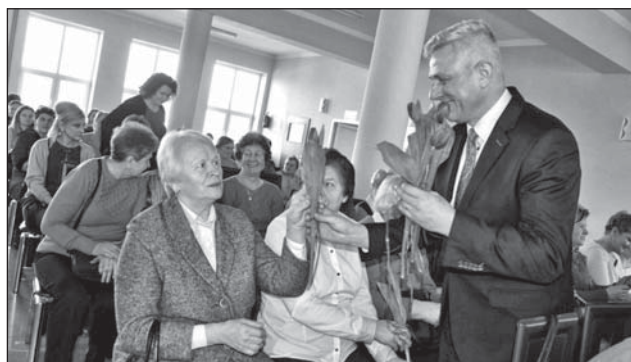
Kwiatek od radnego.