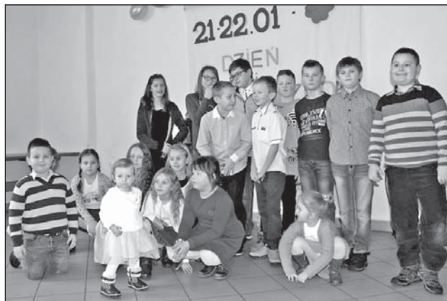
Dzieci z Dąbrowicy Małej przygotowały okolicznościową akademię na Dzień Babci i Dziadka.