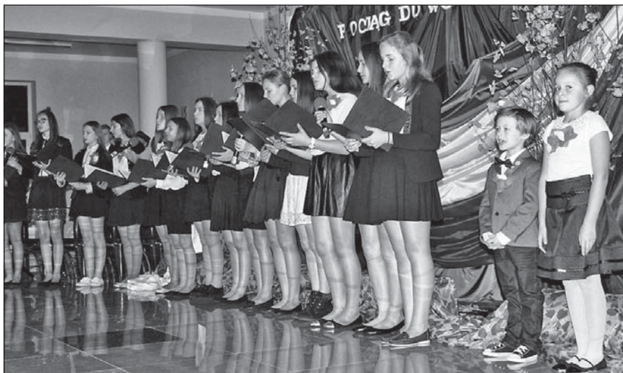
Montaż słowno-muzyczny w wykonaniu uczniów ZPO w Chotyłowie.