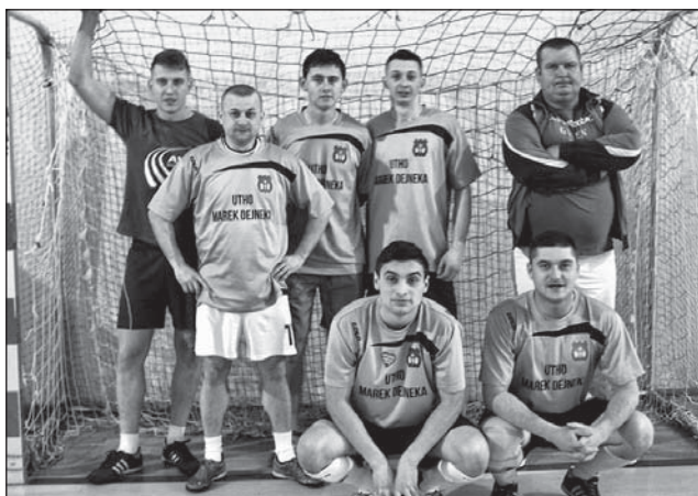
KS Dąbrowica Mała zajęła 3 lokatę.