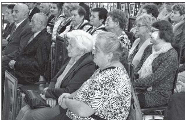
Publiczność słuchała z zainteresowaniem.