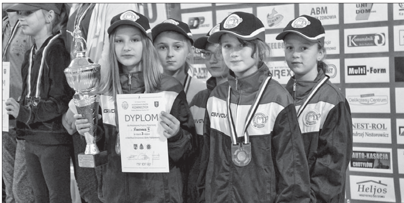
Dziewczęta z Piszczaca zajęły 3 miejsce.