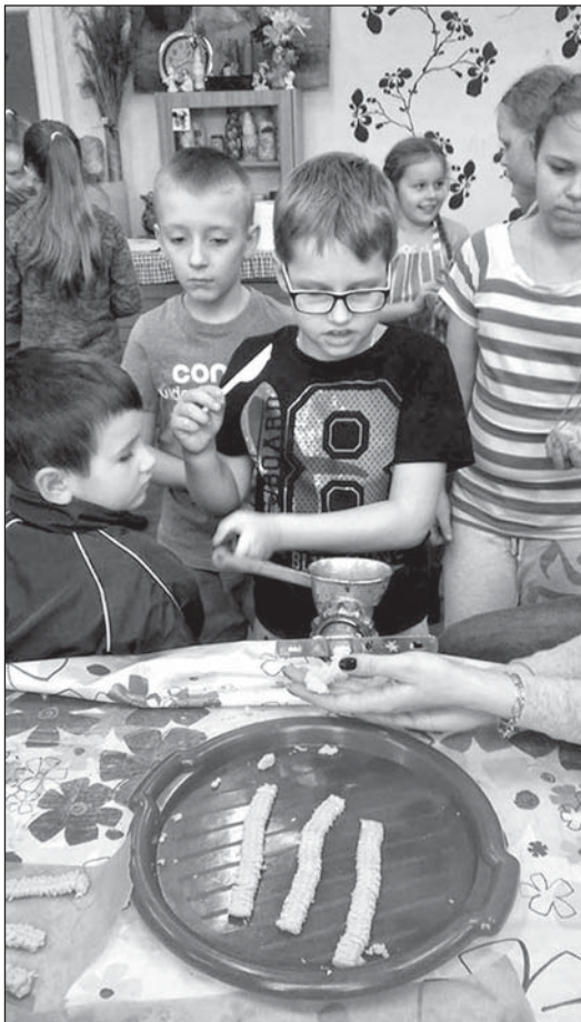
W ferie dzieci robiły tradycyjne ciastka przez maszynkę.