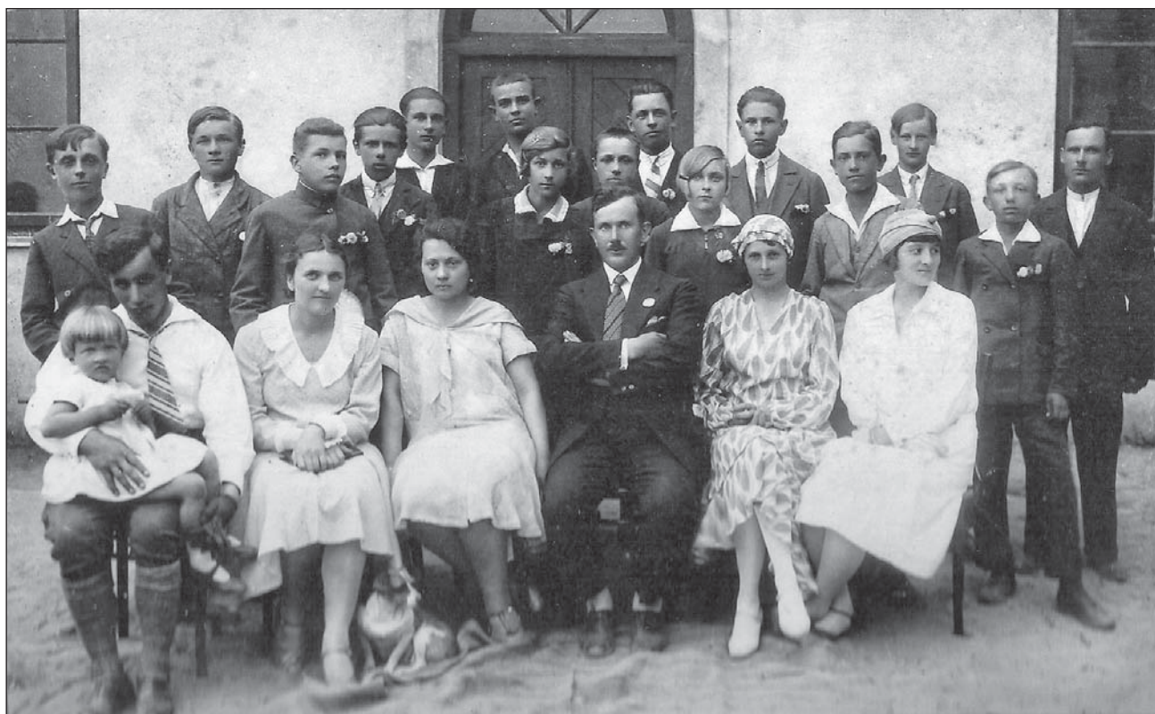
Mieszkańcy gminy Piszczac lata 50-te XX wieku.