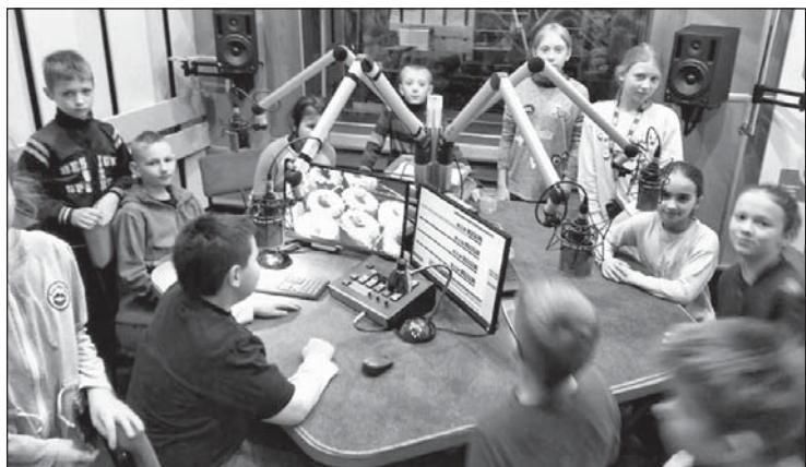
Zwiedzanie studia radiowego.