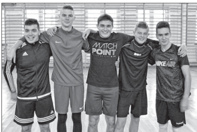
Drużyna z Piszczaca.