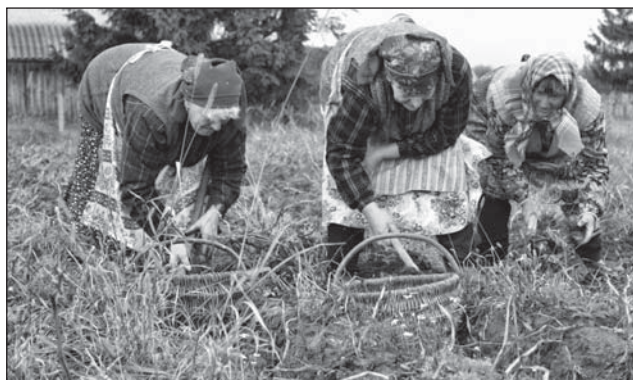
Prace na polu odbywały się z użyciem dawnych narzędzi.