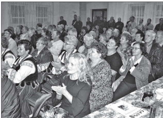
Publiczność zgromadzona w świetlicy w Dąbrowicy Małej oklaskiwała występujących.