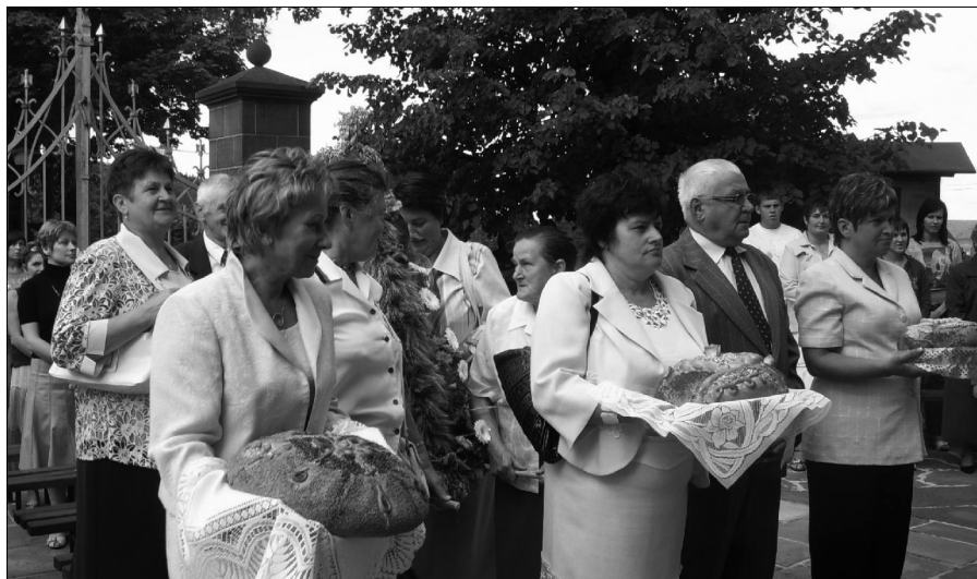
Delegacje z poszczególnych sołectw z dożynkowymi darami.