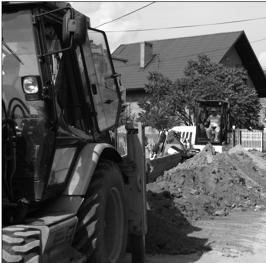
Budowa kanalizacji w Samsonowie – Komornikach