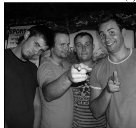
Kabaret Skeczów Męczących z Kielc pozdrawia czytelników „Gazety Zagnańskiej”