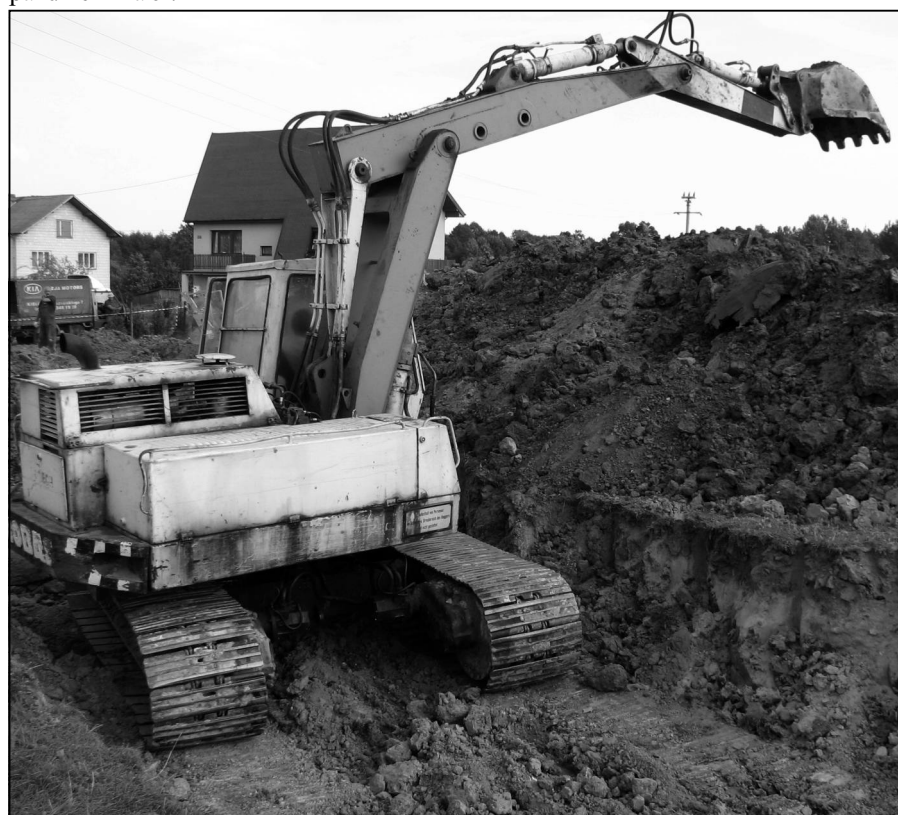
Budowa kanalizacji w Tumlinie - Dąbrówce

Planowana jest przebudowa drogi powiatowej : Długojów - Kołomań , długości ok. 1200 m, na dwóch odcinkach. Modernizacja polegać ma na poszerzeniu drogi, położeniu nawierzchni bitumicznej oraz budowie zjazdów do lasu oraz na posesje. Wartość tego przedsięwzięcia - 354 tys. zł, w kosztach ma partycypować Powiatowy Zarząd Dróg. Wykonawca - firma „FART” - łąda dzień wejdzie na plac budowy. Zakończenie prac przewidziano do końca października br.