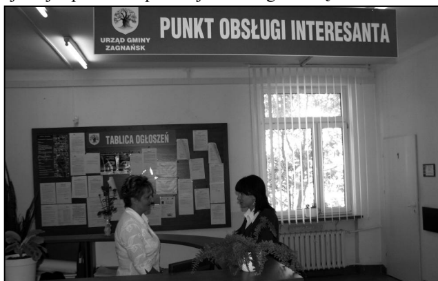
Od ponad dwóch tygodni na parterze Urzędu Gminy funkcjonuje Punkt Obsługi Interesanta.