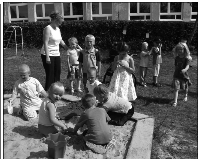
Maluchy z drugiego oddziału przedszkolnego w Tumlinie chętnie korzystają z dobrej pogody i bawią się w ogródku przyszkolnym.