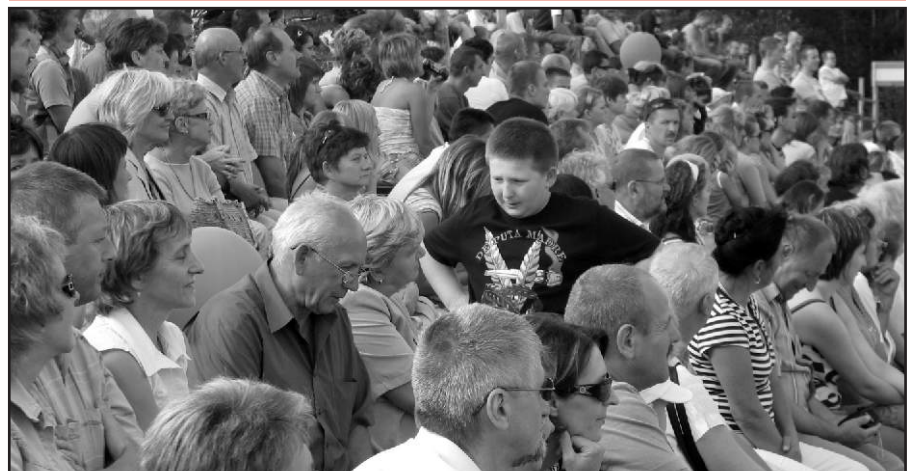
Na pożegnanie wakacji przyszły tłumy...