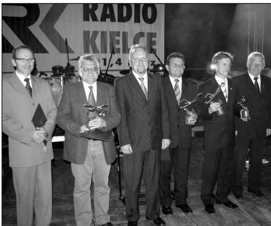
Burmistrzowie oraz wójtowie wyróżnionych kąpielisk z wojewodą świętokrzyskim i prezesem ZW WOPR na letniej scenie przy Kieleckim Centrum Kultury.

Wszystkim uczniom oraz kadrze pedagogów i wychowawców życzymy samych sukcesów w nowym 2007/2008 roku szkolnym. (J.)