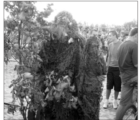
Na festynie w Kaniowie zjawiał się nawet sam Dąb „Bartek”. Prawda, że jak żywy?

publicznością. Tym bardziej, że pod koniec lata dzień robi się coraz krótszy... (J.K.)