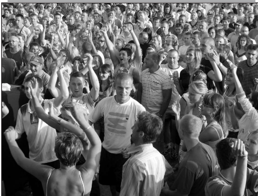
Pożegnanie wakacji w Kaniowie