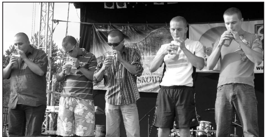
Piwoosze w konkursie picia złocistego płynu na czas