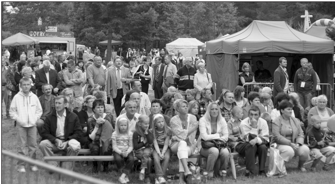
Mimo nie najlepszej pogody, nie zabrakło publiczności na imprezie z okazji Dnia Zagnańskiego.