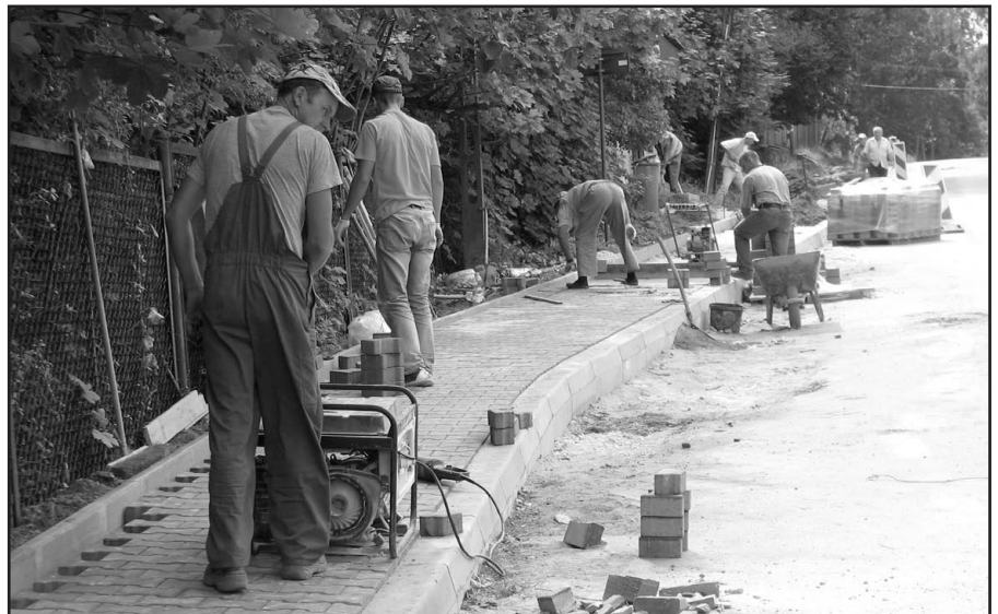
Budowa chodnika z czerwonej kostki brukowej przy ul. Kieleckiej weszła w ostatnią fazę.

realizację budowy dróg: Jaworze – Siodła, Zagnańsk - Bartkowie Wzgórze oraz w rejonie zbiornika w Kaniowie. Szerzej o tych inwestycjach napiszemy w stosownym czasie. (Kos.)