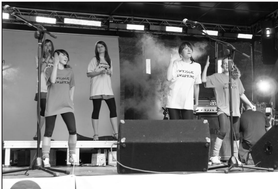
Kabaret „Wyście Awaryjne” z Samsonowa wprowadził widownię w dobry nastrój.