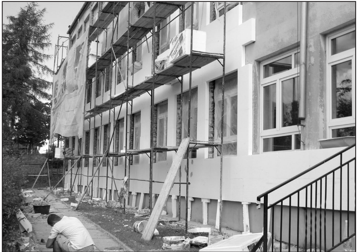
Prace przy ocieplaniu elewacji frontowej szkoły w Tumlinie.

Trzeba dodać, że we wszystkich placówkach oświatowych trwają prace konserwatorsko – porządkowe do rozpoczęcia zajęć lekcyjnych – 1 września br. Wiele drobnych robót wykonują pracownicy administracyjni szkół, w niektórych placówkach pomagają rodzice uczniów. A wszystko po to, by nasi milusińscy mogli rozpocząć nowy rok szkolny 2009/2010 w odpowiednich warunkach.