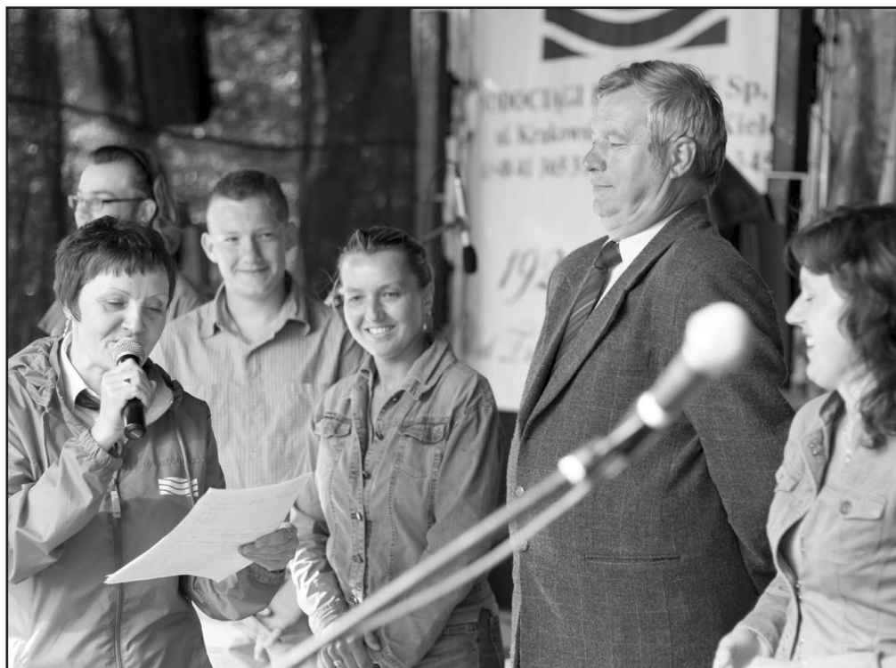
Konkurs o „Wodociągach Kieleckich” zgromadził wielu chętnych.

Do sierpniowego wydania gazety załączona jest wkładka zawierająca ogłoszenie o drugim przetargu ustnym, nieograniczonym, na sprzedaż nieruchomości zabudowanej budynkiem gospodarczym położonej w Zagnańsku przy ul. Słonecznej.