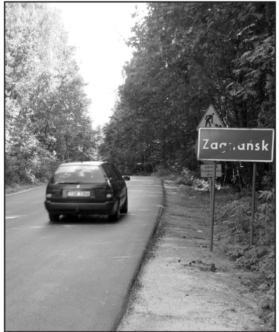
Nowy dywanik asfaltowy na ul. Kieleckiej, to miód na serce kierowców jeżdżących tą drogą.

Dodajmy, że przygotowywane są kolejne inwestycje drogowe w gminie: Jak nam wiadomo, udało się załatwić pomoc finansową z Unii Europejskiej na