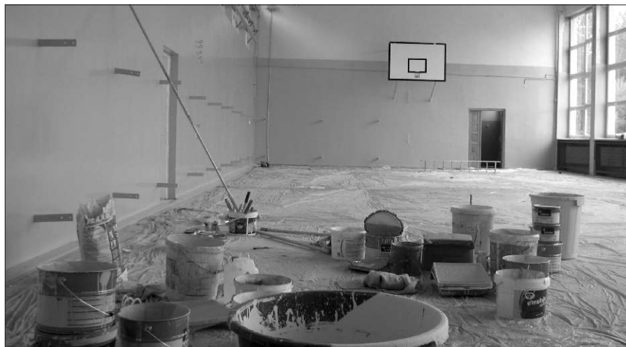
Malowanie sali gimnastycznej w szkole nr 2 w Zagnańsku odbywa się systemem gospodarczym.

Do prac zaangażowano cztery firmy budowlane z Kielc i Zagnańska, niezależnie od tych wykonawców wiele napraw szkoły wykonują we własnym zakresie i z własnych środków. Pomocą służą też rodzice uczniów.