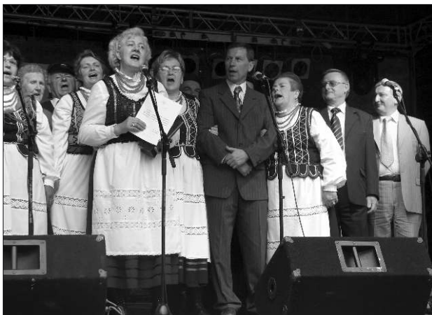
Wspólne śpiewanie na festynowej estradzie w Borowej Górze.