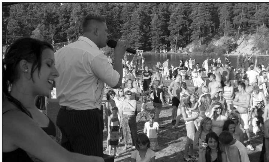
Piknik disco polo nad zalewem w Kaniowie.