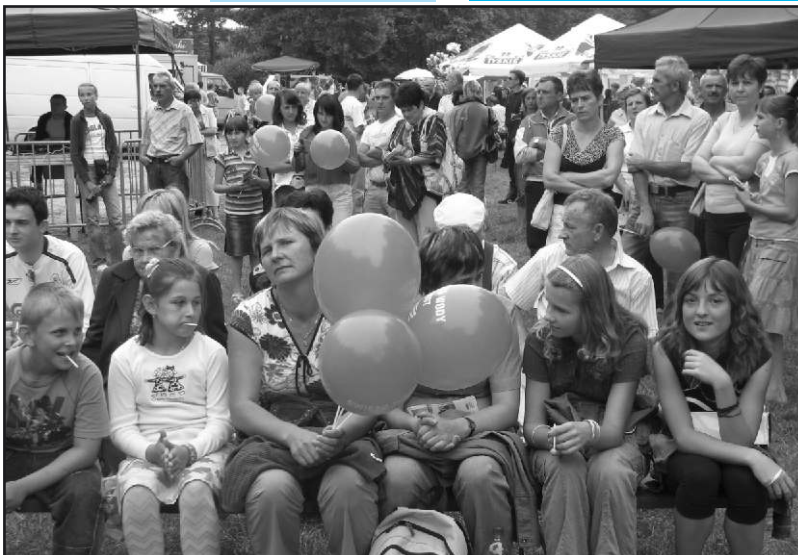
Dzień Zagnańska zgromadził tony mieszkańców gminy.