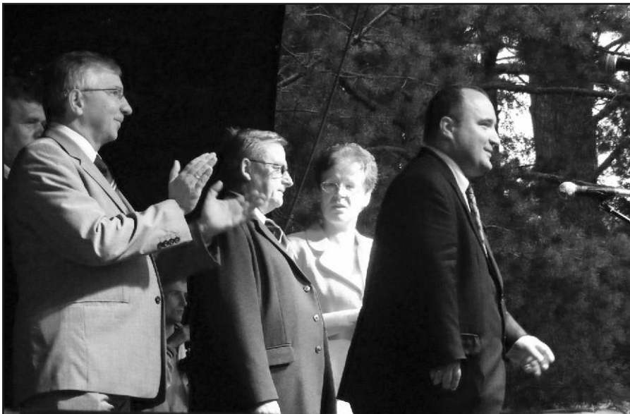
Do mieszkańców gminy przemawia gość honorowy festynu wicepremier Przemysław Gosiewski.