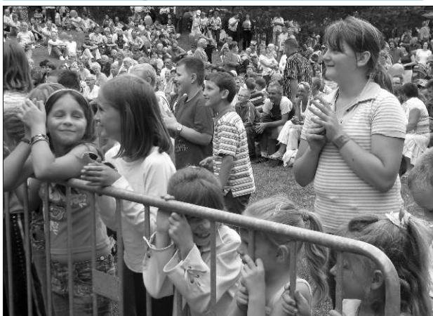
Najlepiej na festynie bawiły się dzieci i młodzież.