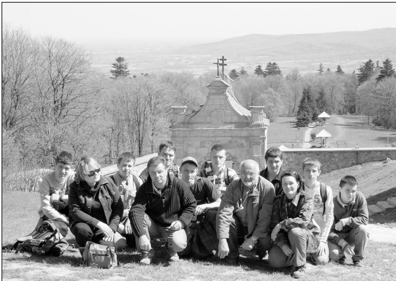
Wspólna wycieczka młodzieży niemieckiej i polskiej na Święty Krzyż.

Skarby Vogtlandu i nowa tradycja w „Leśniku” - czytaj na str. 4