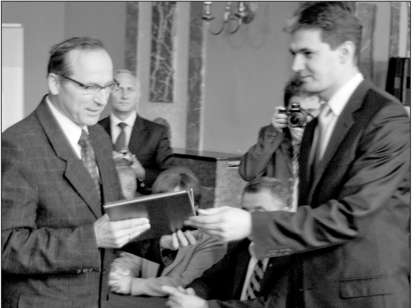
Wójt uroczyście odbiera podpisany wniosek o dofinansowanie na drogi.