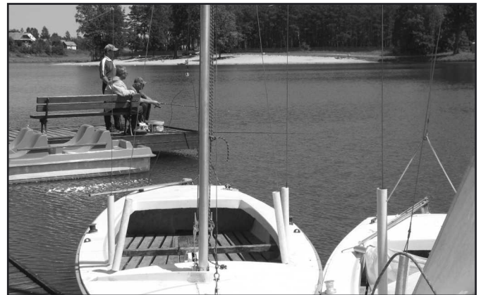
Zalew w Umrze, to także raj dla wędkarzy...