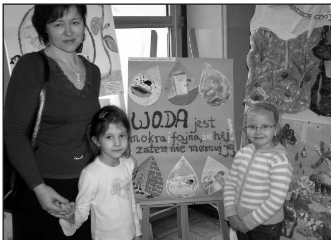
Maluchy z Samsonowa wyróżnione!