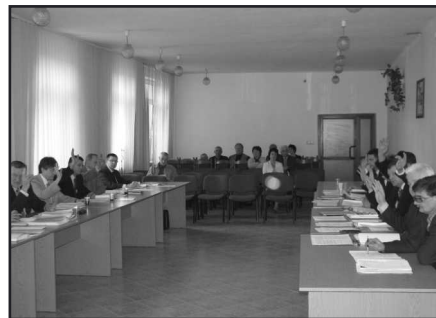
Radni udzielają absolutorium wójtowi gminy za jego owocną pracę w 2007 roku.