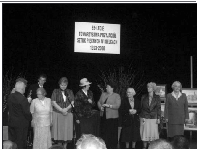
Wyróżnieni członkowie i sympatycy TPSP, na jubileuszowej imprezie w Kielcach.