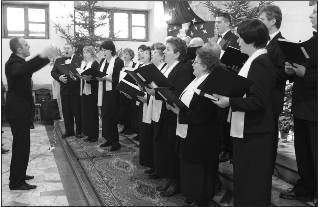
Chór z Zagnańska.