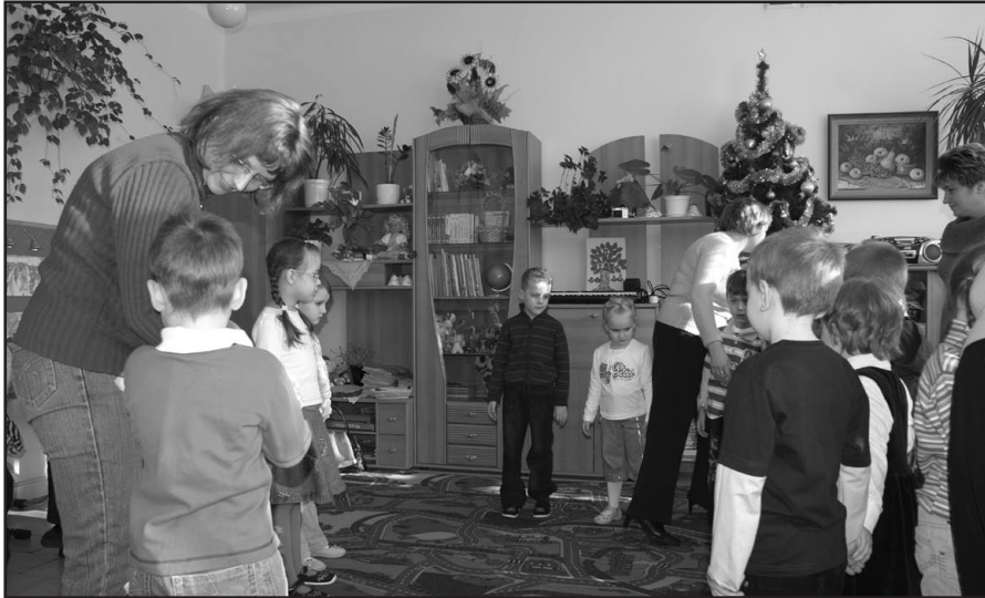
Dzieci chętnie się bawiły w nowym miejscu.