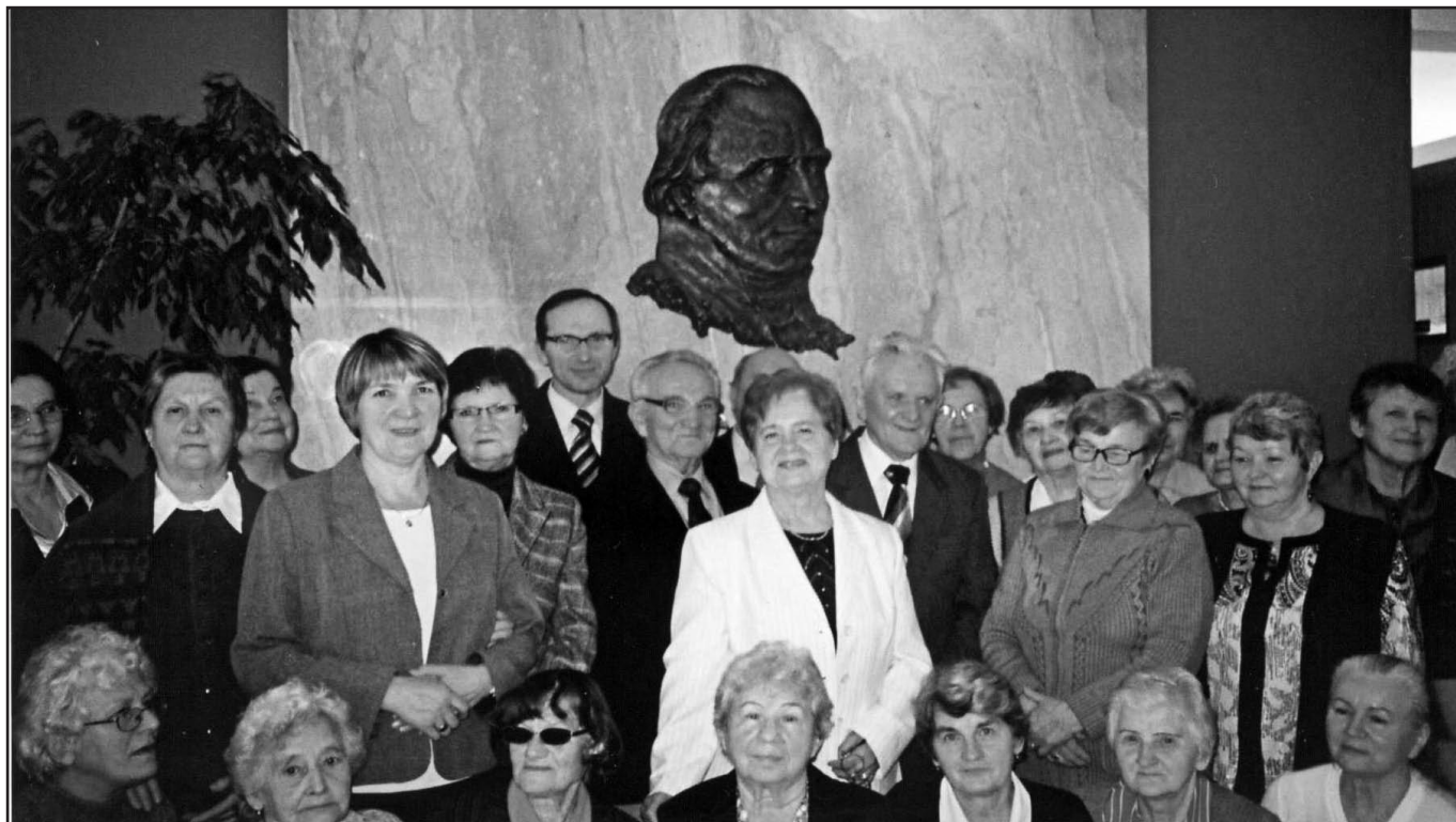
Pamiątkowe zdjęcie pod popiersiem patrona szkoły Stanisława Staszica.