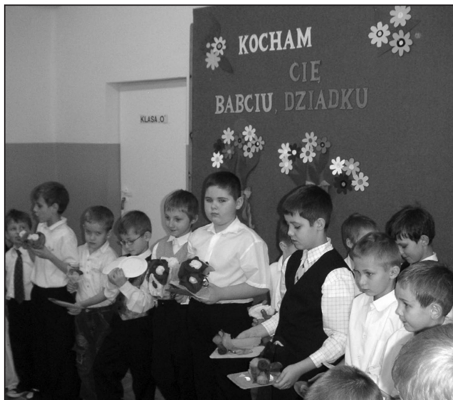
Dzieci na spotkaniu z dziadkami i babciami.

Fąfara, składając wszystkim babciom i dziadkom najserdeczniejsze życzenia z okazji ich święta. Podczas spotkania uczniowie klas od 0 do 3, recytowali wiersze, śpiewali piosenki oraz prezentowali tańce: nowoczesne, walca a także „pszczołkę Maję”. Ogromną popularnością cieszyły się liczne konkursy oraz zabawa babć i dziadków ze swoimi wnuczętami. Imprezę zakończono poczęstunkiem dla dziadków, który specjalnie na tę uroczystość przygotowali rodzice uczniów.