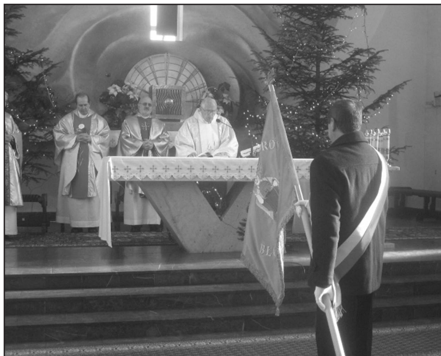
Sztandar przygotowany do poświęcenia

działaczom Koła „Bartek” za dotychczasową działalność, życząc jednocześnie by nowy sztandar jedno-