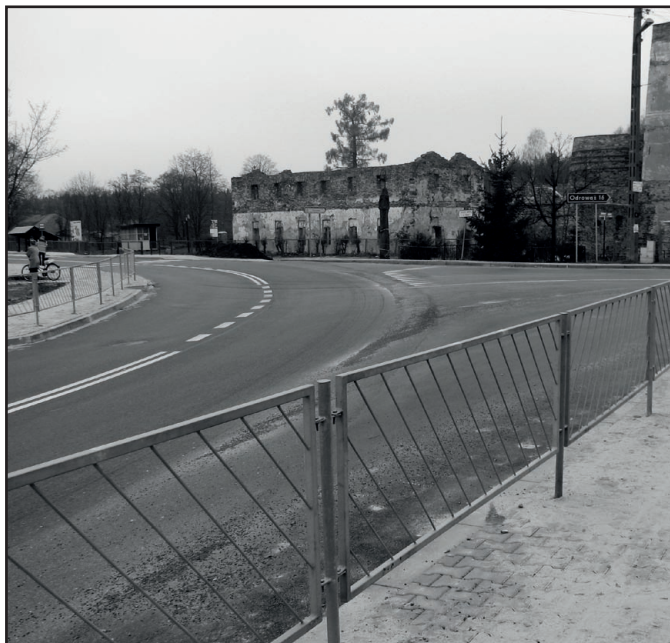
Przebudowane skrzyżowanie dróg w Samsonowie

Kanalizacja, wodociągi, drogi, oświetlenie