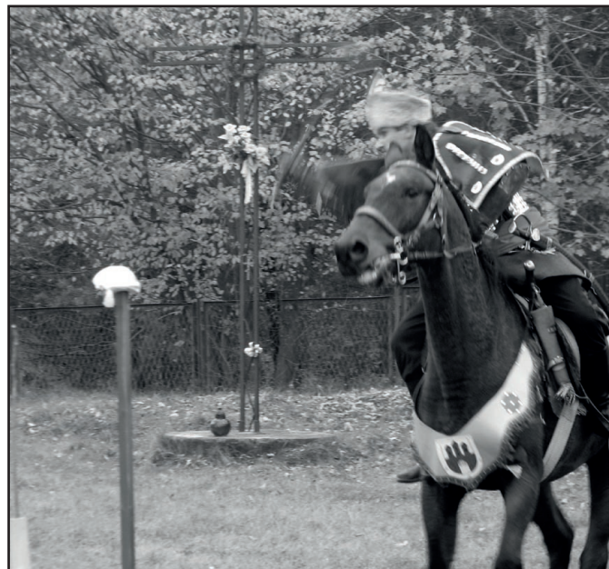
Ułan w natarciu - pokaz walk na szable obok ruin Huty Józefa