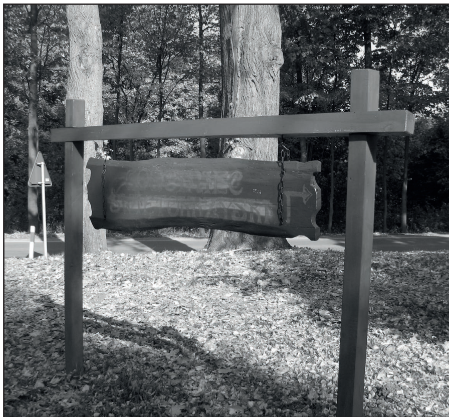
Nawet ten znak informacyjny, przy Dębie „Bartku”, także przeszkadzał jakiemuś wandalowi spod znaku graffiti.

nie je zamontowano na jakiejś działce. Rzecz w tym, że za kawałek nowego chodnika w prywatnym ogródku, za