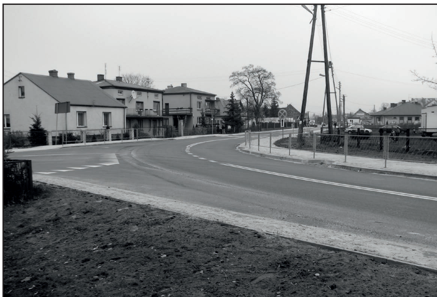
Skrzyżowanie dróg w Samsonowie po modernizacji, widok na drogę do Miedzianej Góry

Kanalizacja, wodociągi, drogi, oświetlenie