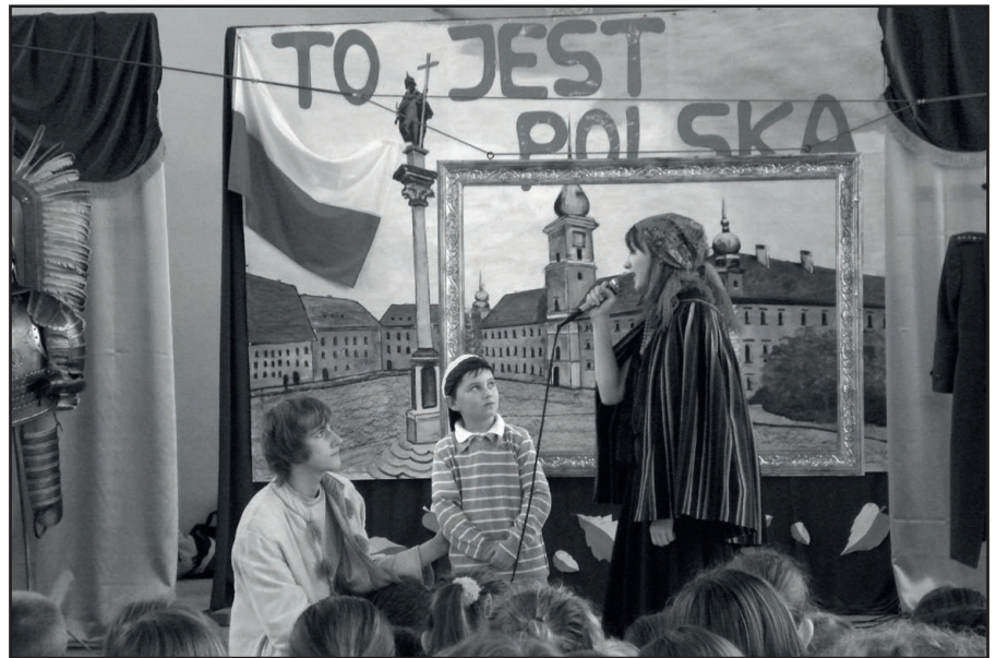
Fragmety patriotycznego spektaklu w szkole, w Zagnańsku