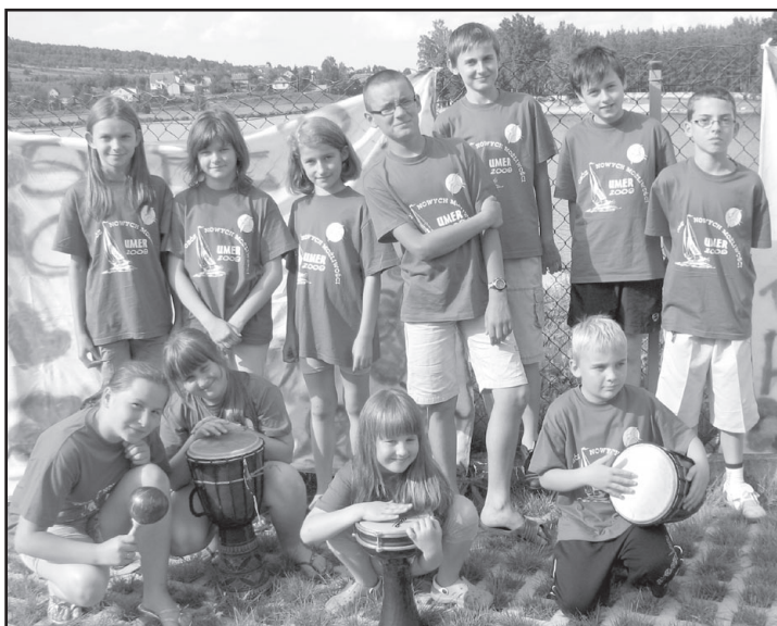
Uczestnicy obozu z gminy Zagnańsk.

Realizacja tego zamierzenia była możliwa dzięki pracy jaką wykonali członkowie stowa-