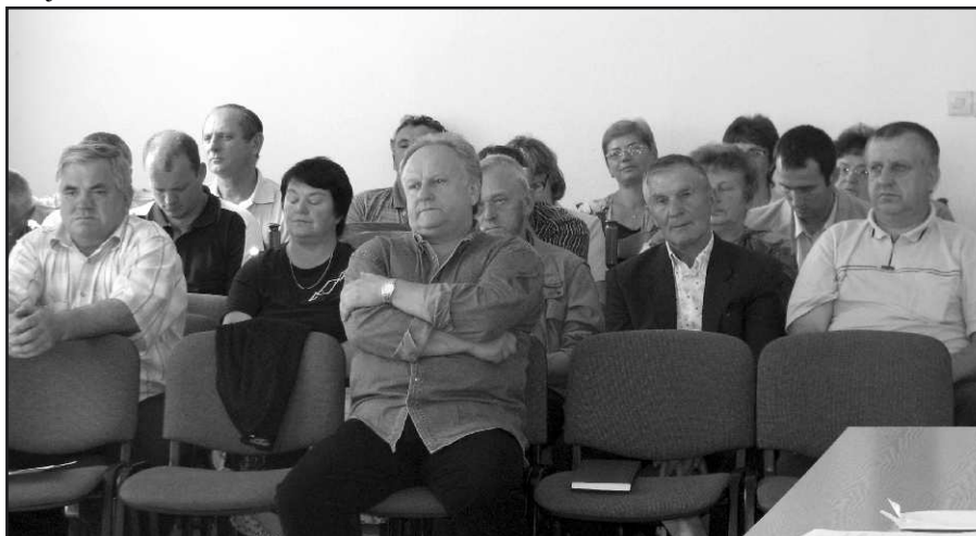
Sesja Rady Gminy - w „łozy” publiczności m.in. sołtysi i przewodniczący rad sołectkich.