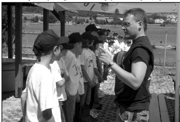
Pierwsza zbiórka na obozie: zajęcia prowadzą instruktorzy, nauczyciele ze szkoły w Tumlinie.