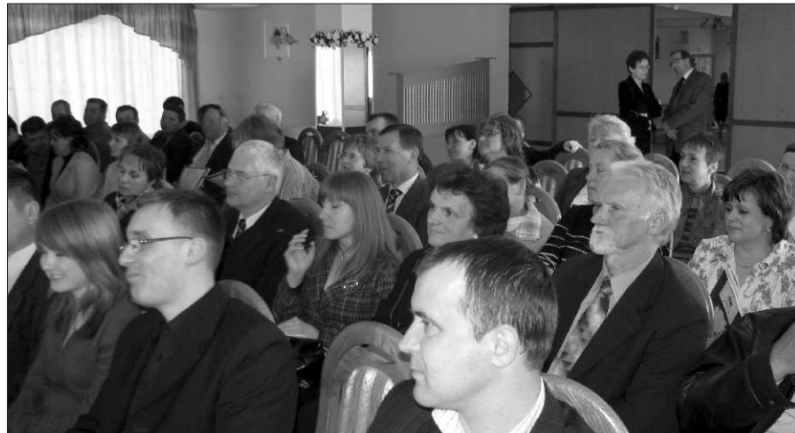
Sala obrad w Hotelu "Pod Jaskółką".

- rozwój bazy dla uprawiania sportów wodnych (zagospodarowanie istniejących i budowa nowych zbiorników wodnych) i innych form turystyki aktywnej - produkt