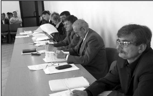
Radni podczas obrad.