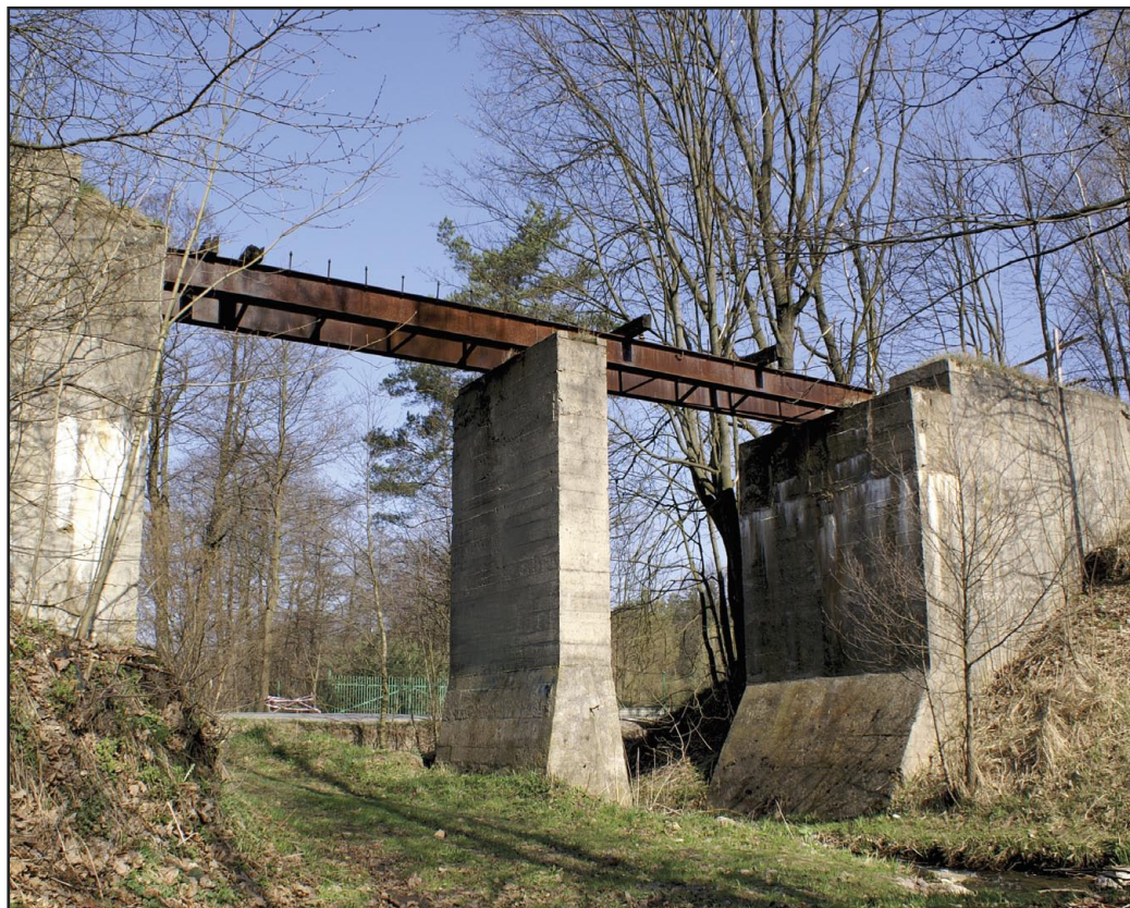
Pozostałości po kolejce w okolicy Borowej Góry.