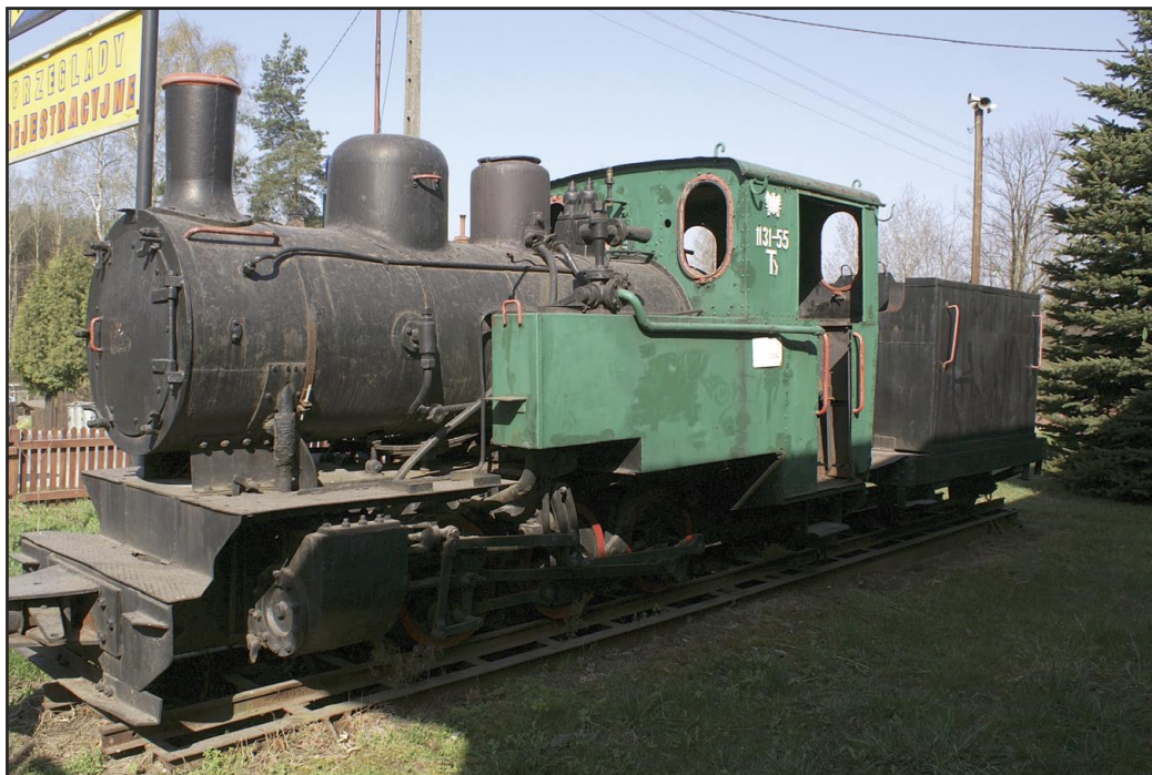
Zabytkowy parowóz w Zagnańsku.