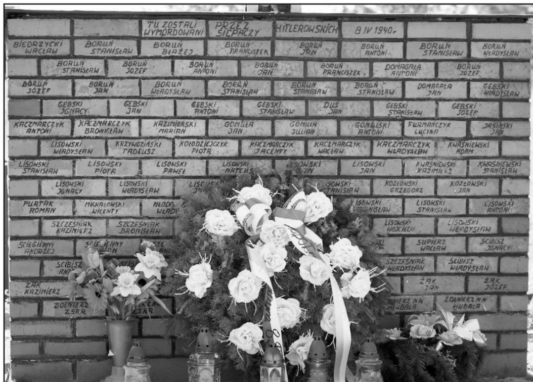
Pomnik upamiętniający pacyfikację mieszkańców wsi Szalas.