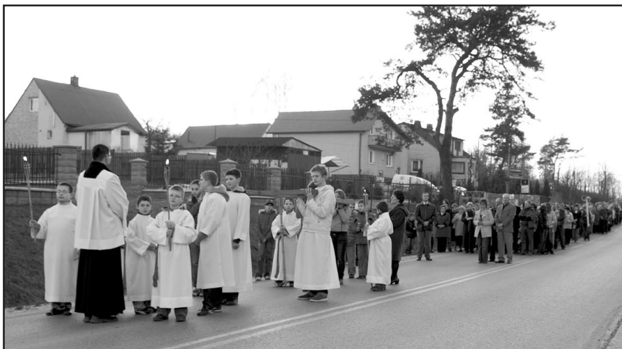
Parafialna droga krzyżowa od Dęba Bartka.

Jan Paweł II, nazywany Wielkim. Sam był zawsze bardzo skromny, my pamiętamy go jako najwybitniejszego Polaka. Niezliczone są chyba dzieła, jakich dokonał w swoim pontyfikacie. Dzisiejszemu człowiekowi potrzebne są autorytety i wzorce moralne. Taki przykład pięknego życia, dawał Karol Wojtyła. Dobrze pamiętamy, co czuliśmy, gdy cztery lata temu media podały informację, że Ojciec Święty nie żyje. Zjednoczyliśmy się wówczas w smutku i modlitwie. Fenomen Jana Pawła II polega na tym, że nawet po swojej śmierci, potrafi nas zjednoczyć. Takie wspólne obchody 4 rocznicy śmierci Papieża Polaka można było zaobserwować na ca-