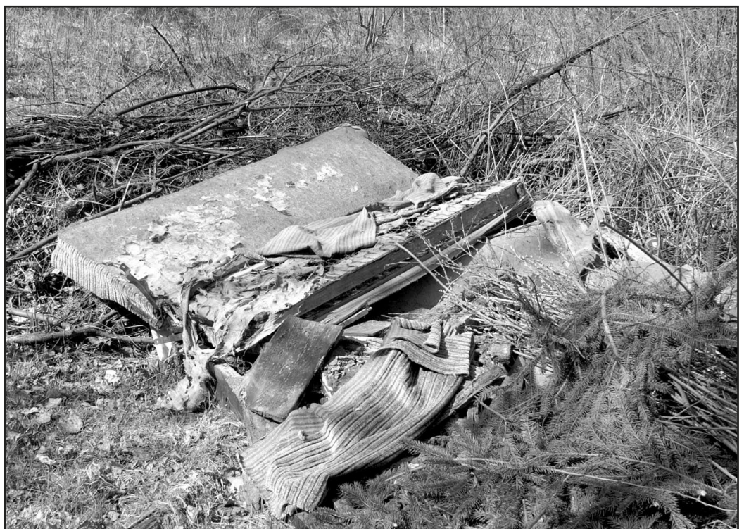
Takie widoki straszą w naszych lasach.