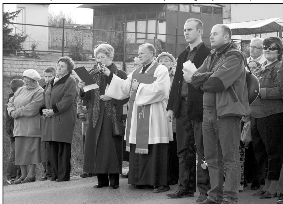
Wierni odczytują kolejne stacje drogi krzyżowej.

łym świecie. Również Gmina Zagnańsk brała udział w takich uroczystościach. We wszystkich parafiach gminy wierni spotykali się na modlitwach, odprawiano uroczyste msze święte. Parafia św. Józefa w Zagnańsku szczególnie obchodziła ten dzień. Trzeciego kwietnia kilkaset osób z parafii i okolic zebrało się późnym popołudniem na placu koło Dęba Bartka. Rozpoczęła się tu parafialna droga krzyżowa. Jej motywem przewodnim było prześladowanie i dyskryminacja ludzi z powodu ich wiary. Temat, o którym bardzo dużo mówił Papież - Polak. Po dotarciu do ostatniej stacji, pamięć Ojca Świętego, uczczono składając lampki i świece na placu przed kościołem. Na uroczystości nie zabrakło przedstawicieli władz gminnych. Na zakończenie, wielu parafian zostało na placu i modliło się o rychłą beatyfikację Jana Pawła II.