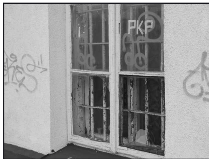
Wybita szyba w oknie dworca, od strony peronów