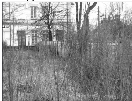
Skwer, na którym kiedyś stały ławeczki, zarósł chaszczami