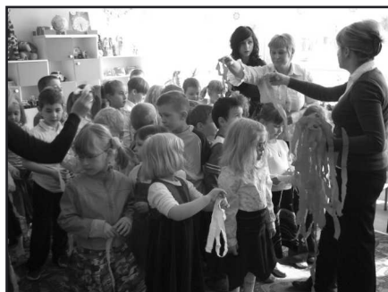
Przedszkolaki oraz maluchy z „zerówki” na spotkaniu w Tumlinie

wane przez wicewojewodę i jego pracownice upominkami w postaci książeczek o patriotycznej treści oraz zestawami edukacyjnymi. Ta lekcja patriotycznego wychowania na pewno pozostanie na długo w pamięci najmłodszych uczniów i przedszkolaków ze szkoły w Tumlinie. (Kos.)