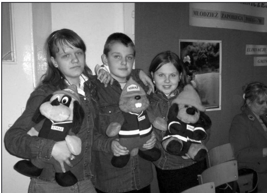
Laureaci Turnieju Wiedzy Pożarniczej w Szalasie

Zwycięzcy turnieju otrzymali nagrody ufundowane przez Urząd Gminy w Zagnańsku, Nadleśnictwo Zagnańsk , natomiast poczęstunek dla wszystkich uczniów i opiekunów zorganizował Zakład Piekarniczy Emila Więckowskiego .