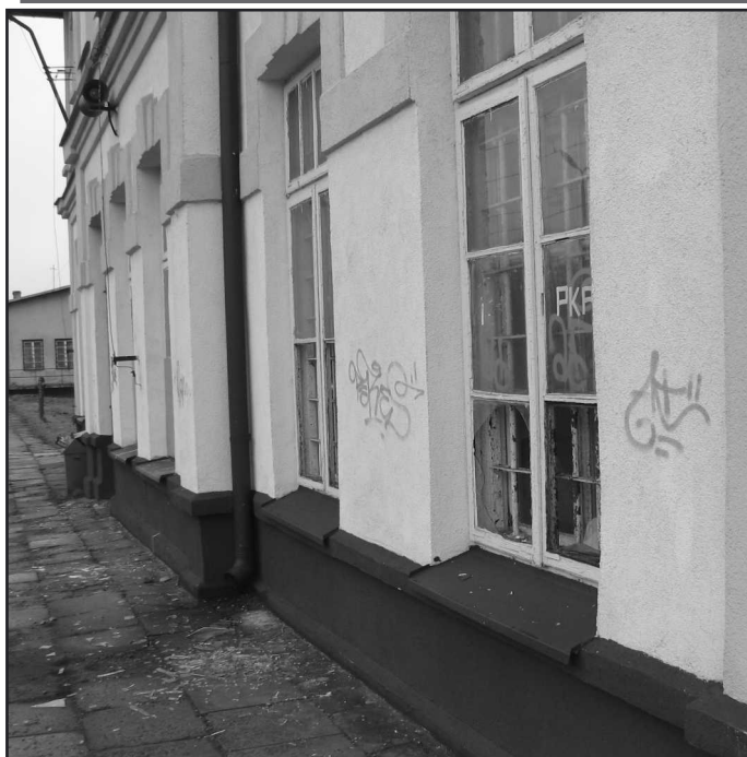
Potłuczone szyby, pomalowana elewacja – oto wizytówka stacji Zagnańsk