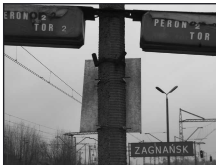
Zniszczone tablice na peronach