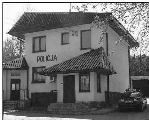
Posterunek Policji w Zagnańsku.

Posterunek Policji w Zagnańsku Komisariatu Policji w Bodzentynie w swej obecnej formie funkcjonuje od 16 lipca 2002 r. Posterunek liczy obecnie etatowo 8 funkcjonariuszy. W tym kierownikowi posterunku podlega: dwóch funkcjonariuszy zespołu ds. kryminalnych, dwóch dzielnicowych, trzech policjantów zespołu patrolowego. Policjanci pełnią służbę w systemie zmianowym. (kp)