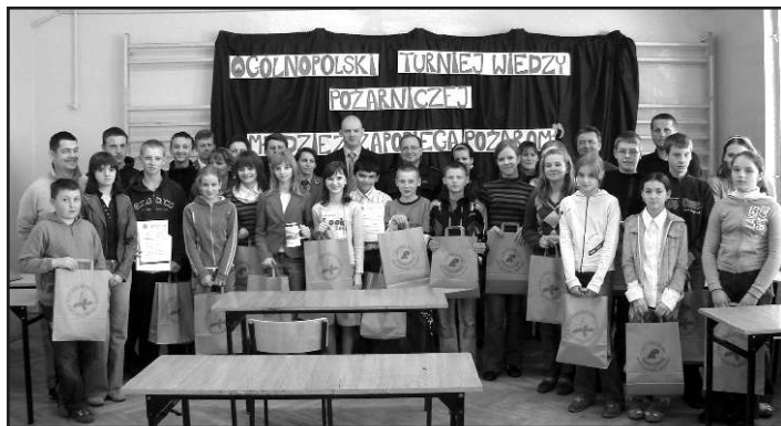
Uczestnicy konkursu wraz z opiekunami i organizatorami.