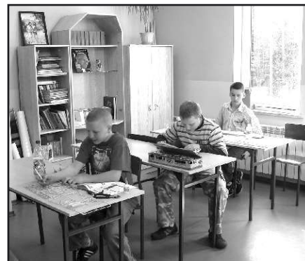
Młodzież przy sklepaniu modeli.

Gminny Ośrodek Kultury, Sportu i Rekreacji w Zagnańsku zaprasza na zajęcia kółka modelarskiego. Każdy młody człowiek, który pragnie sprawdzić swoje zdolności manualne może przyjść z własnym modelem i pod okiem osoby prowadzącej oraz kolegów składać go w całość. Wszelkie akcesoria tj. farby, kleje i narzędzia zostały sfinansowane dzięki pomocy Urzędu Gminy. To wspaniały sposób na nudę i spędzenie czasu z kolegami w pożyteczny dla siebie i innych sposób. Chętnych zapraszamy we wtorki i czwartki w godz. 16 - 19 do hali sportowej, sala 203 na pierwszym piętrze.