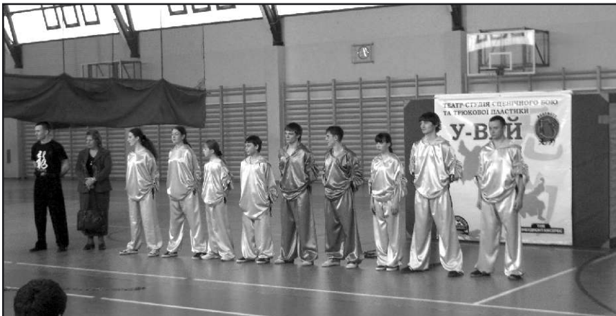
Młodzież z ukraińskiej Strizawki podczas występu na hali w Zagdańsku.