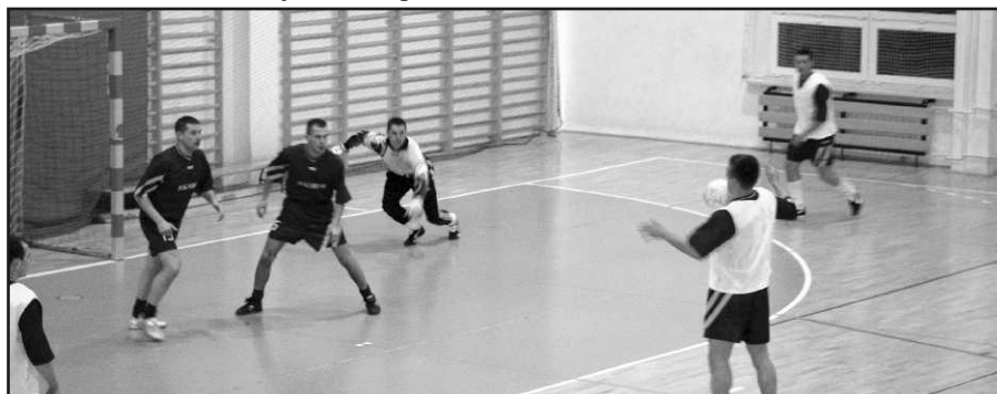
Fragment meczu finałowego.

1. „Orlicz” Suchedniów 2. „Lubrzanka” Kajetanów 3. „Orlęta” Kielce 4. „Piast” Chęciny