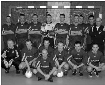
Drużyna „Lubrzanki” Kajetanów.

Pod znakiem dominacji piłkarzy „Lubrzanki” Kajetanów stał IV Gminny Turniej Piłki Nożnej Klubów z gminy Zagłębińsk. W fazie eliminacji największą niespodziankę sprawili piłkarze „Samsona II”, którzy zremisowali z „Lubrzanką II” 2-2. Do rywalizacji przystąpiły trzy kluby, każdy wystawił po dwie drużyny.