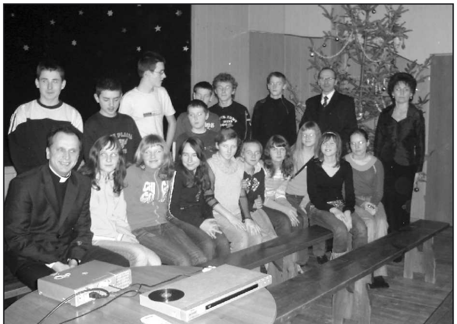
Młodzież i zaproszeni goście podczas prezentacji filmu.