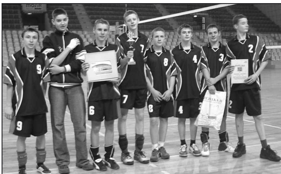
Reprezentacja Gimnazjum w Zagnańsku w piłce siatkowej.