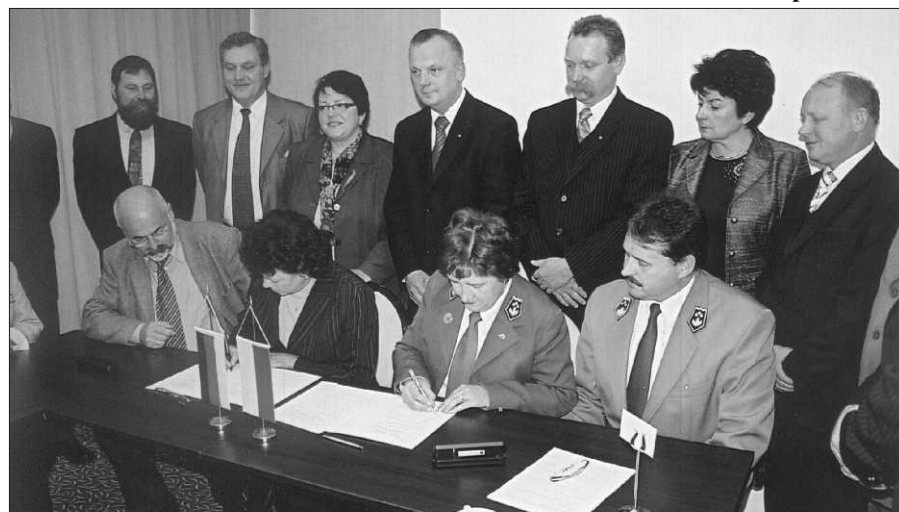
Moment podpisania umowy o współpracy przez dyrektorów szkoły w Zagnańsku i w Falkenstein w Niemczech.