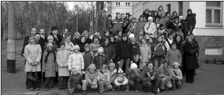
Pamiątkowe zdjęcie uczestników i organizatorów konkursu w Rembertowie.

Uczniowie ze Szkoły Podstawowej i Gimnazjum w Tumlinie zajęli drugie miejsce Ogólnopolskim Konkursie na Wykonanie Bożonarodzeniowej Kolędy.