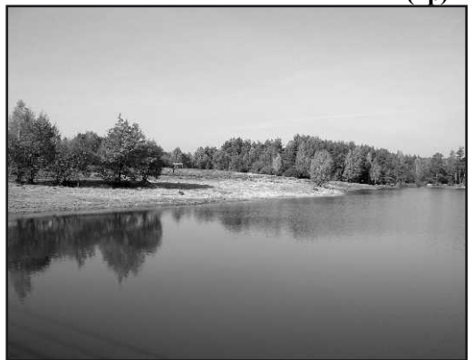
Takie widoki wkrótce znikną nad zalewem.