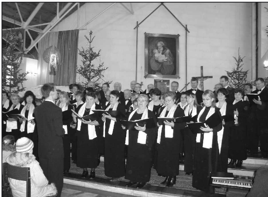
Występ połączonych chórów parafialnych z Zagnańska i Kielc.