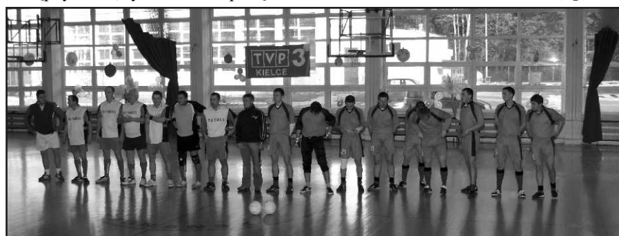
Drużyna reprezentacji zagnańska i kleryków z seminarium.