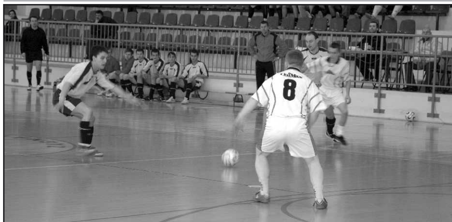
Fragment finałowego meczu.