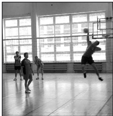
Rozgrzewka przed meczem drużyny z Zagnańska.

Powiatowy turniej w siatkówkę zorganizował Zespół Szkół Leśnych im. Romana Gesinga. Wzięło w nim udział sześć drużyn z: Bodzentyna, Chęcina, Chmielnika, Zagnańska, Podzamecza Chęcińskiego i Nowej Słupi. Poziom sportowych rozgrywek był bardzo wyrównany. (kp)