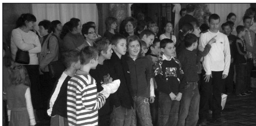
Młodzież oczekująca na przybycie św. Mikołaja.