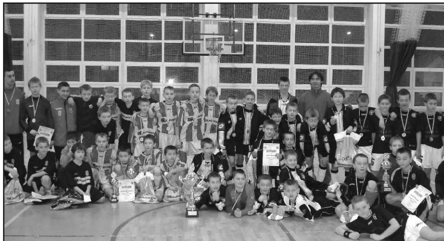
Pamiątkowe zdjęcie uczestników turnieju.