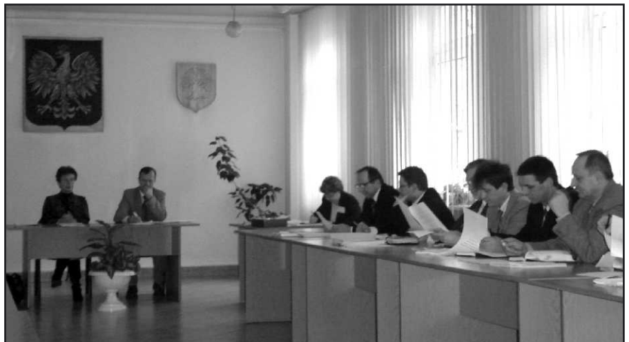
Radni zapoznający się z budżetem.

Radni uchwalili, że dochody budżetu gminy wyniosą w 2007 r. 24 904 339 zł. Z kolei wydatki opiewać będą na kwotę 30 694 853 zł. Deficyt budżetu gminy w wysokości ponad 5 785 514 zł, który zostanie pokryty przychodami pochodzącymi z pożyczek - 3 082 000 zł i nadwyżki budżetowej z lat ubiegłych 2 703 514 zł.